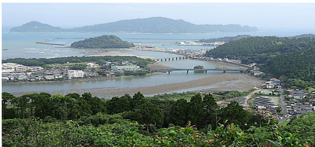
「南郷城跡より撮影」

5. 「正常債権」の金額は、債務者の財務状態及び経営成績に特に問題がない債権であり、「破産更生債権及びこれらに準ずる債権」、「危険債権」、「要管理債権」以外の債権の合計です。