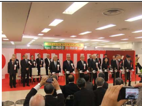
食のビジネスマッチング(池袋サンシャインシティ)