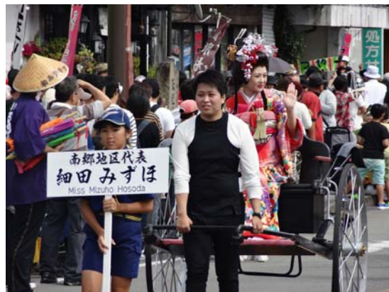
飢肥城下まつりへの職員の参加