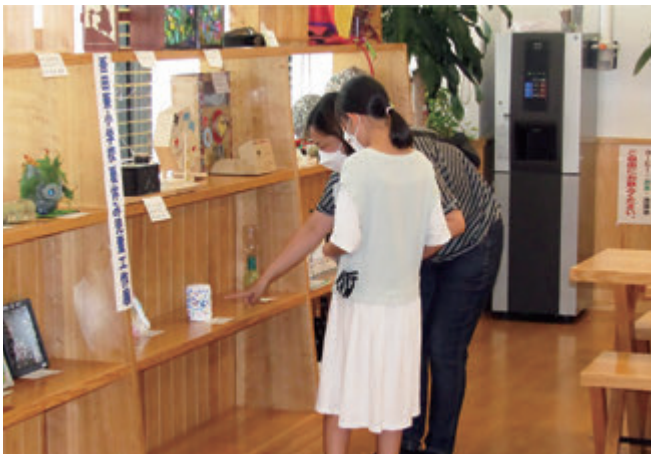
吾田東小学校「夏休み児童作品展」を本店にて開催いたしました。