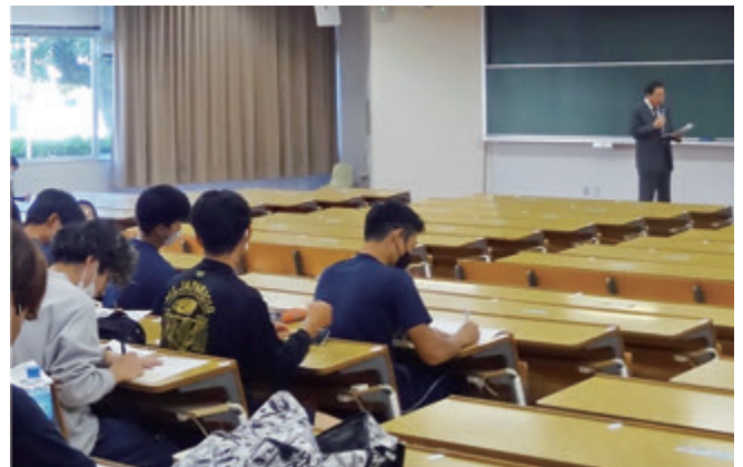
令和4年10月20日、宮崎産業経営大学において、理事長が寄付講座【信用組合論】の講義を行いました。