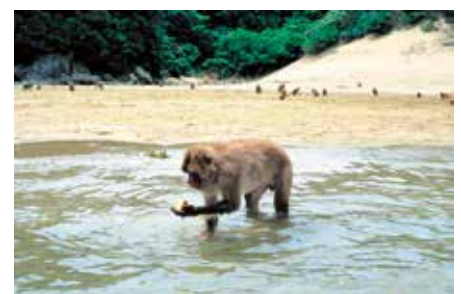
芋を洗う幸島の猿