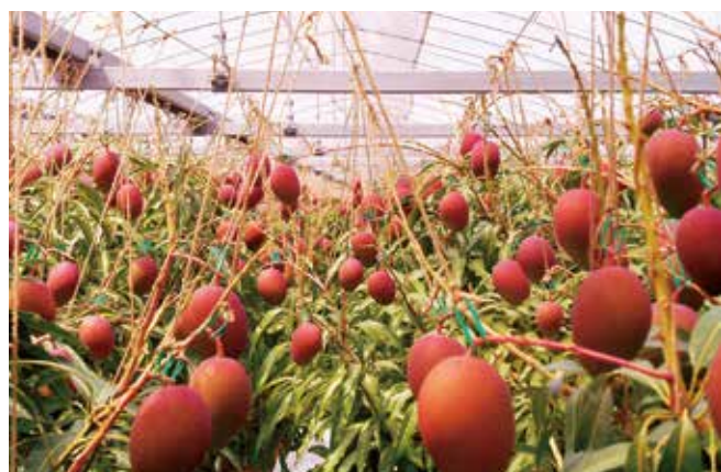
完熟前のマンゴー

2. 「金利リスクに関する事項」については、平成31年金融庁告示第3号（2019年2月18日）による改正を受け、2020年3月末から△NIIを開示することとなりました。