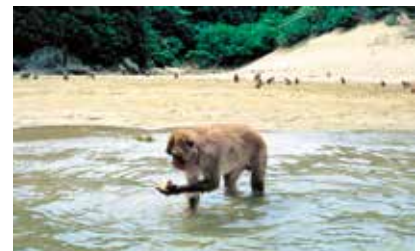
芋を洗う幸島の猿

(注) 当組合は、特定海外債権を保有していませんので「特定海外債権引当勘定」に係る引当は行っていません。