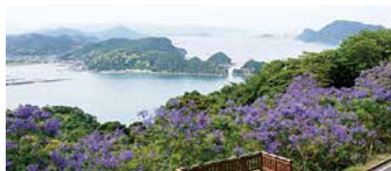
ジャカラダの花と日南海岸