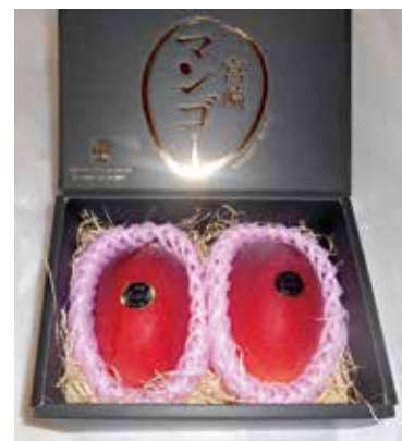
宮崎完熟マンゴー