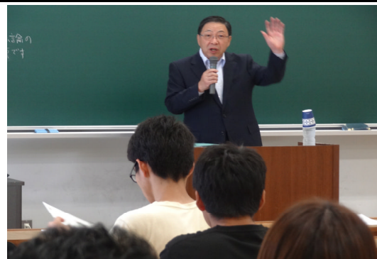
宮崎産経大学での講義