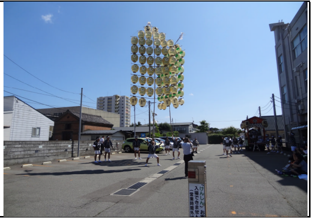
秋田県信用組合訪問