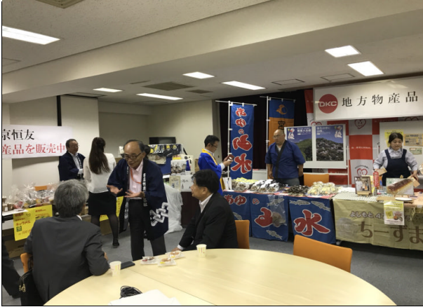
第一勧業信用組合物産展