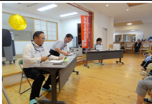
振り込め詐欺防止キャンペーン