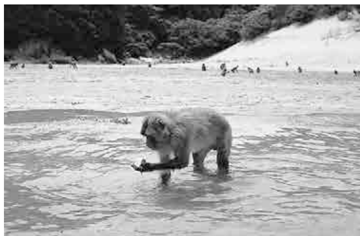
芋を洗う幸島の猿