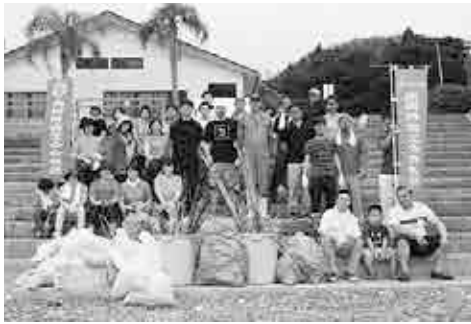
商工会女性部・青年部との清掃ボランティア