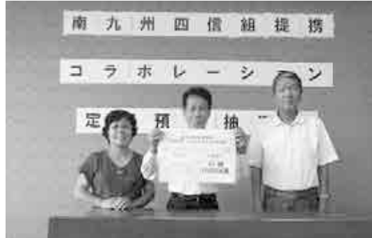
懸賞品付定期預金抽選会