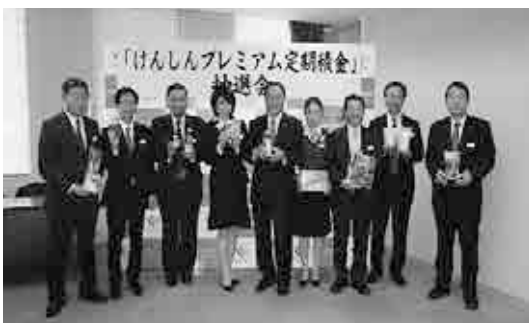
大分県信用組合との連携

平成28年10月18日大分県信用組合において東九州自動車道開通記念「けん しんプレミアム定期積金」の抽選会が開催され、宮崎県産の商品を提供さ せていただきました。また、大東京信用組合の平成28年熊本地震「復興応 援定期」の懸賞品として宮崎産品を提供させていただきました。今後も多 くの信用組合と連携を図ってまいります。