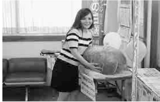
カボチャの重量あてクイズ