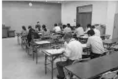
個人ローン研修会