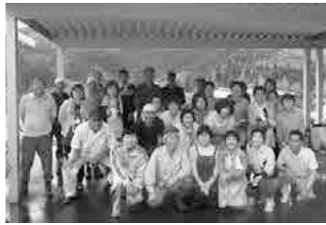
福祉施設清掃ボランティア