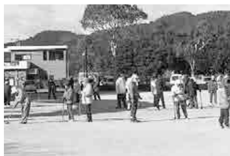
平成29年2月12日(土) 日南市南郷ハートフルセンター 参加 33チーム 168名