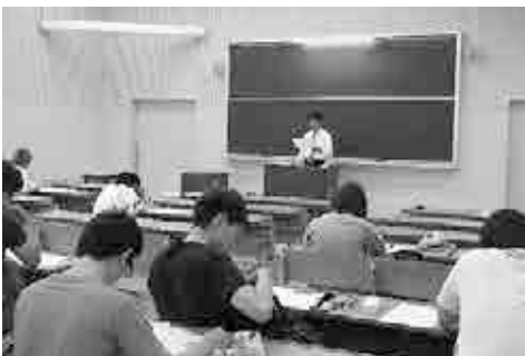
宮崎産業経営大学 5月講義