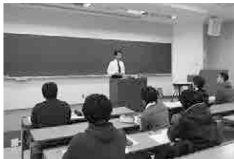
宮崎産業経営大学12月講義

大学教育を通じて、地域社会と中小企業の発展、人材育成を図るため、平成28年5月と12月宮崎産業経営大学において、産学連携の取組みとして全国信用組合中央協会寄付講座「信用組合論」の講義を行いました。