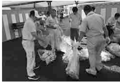
まつりボランティア