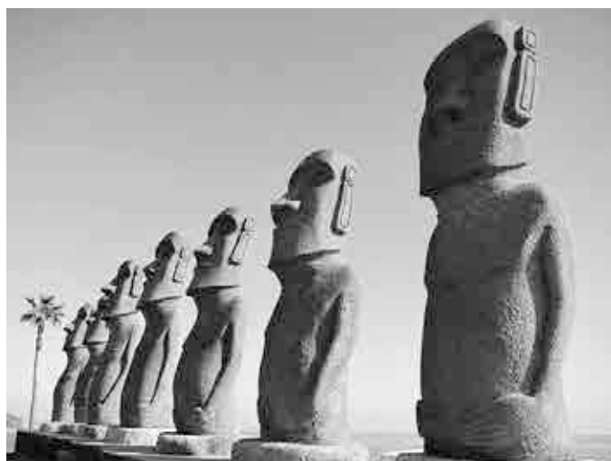
サンメッセ日南のモアイ像

3. コア資本に係る調整項目となったエクスポージャー（経過措置による不算入分を除く）、CVAリスクおよび中央清算機関関連エクスポージャーは含まれておりません。