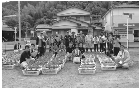
商工会女性部・青年部清掃・植栽ボランティア