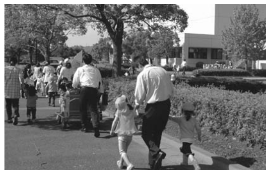
保育園との合同津波避難訓練