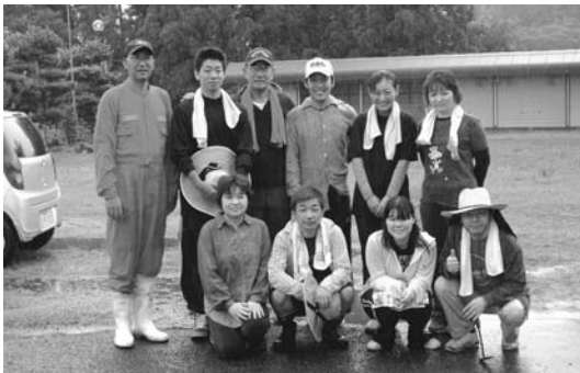
福祉施設清掃ボランティア