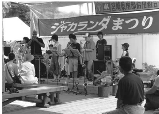
ジャカランダまつりへの協賛