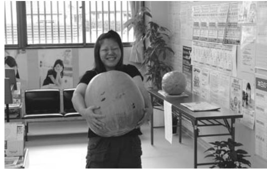
カボチャの重量あてクイズ