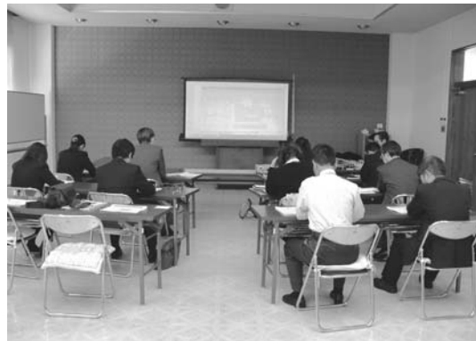
預金保険機構研修