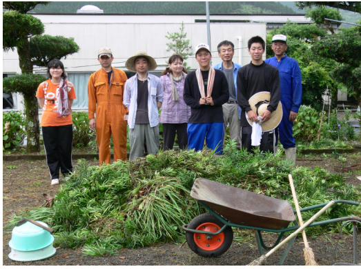
福祉施設清掃ボランティア