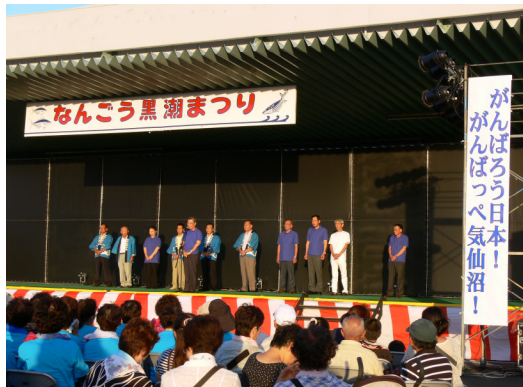
なんごう黒潮まつりへの参加