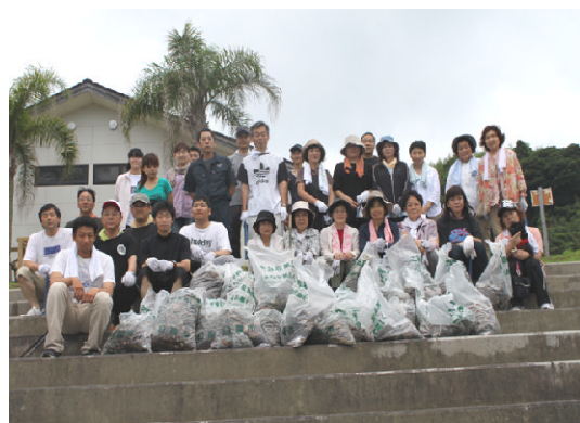
南郷町商工会女性部・青年部清掃ボランティア