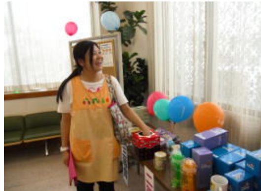
来店プレゼント 日南支店