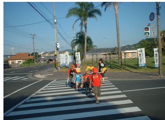
交通指導 串間支店