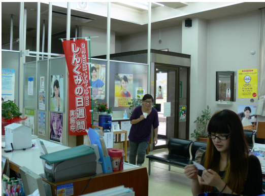
来店プレゼント 本店