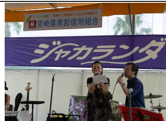
ジャカランダまつりへの協賛