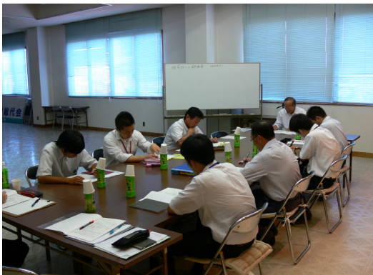
住宅ローン研修会