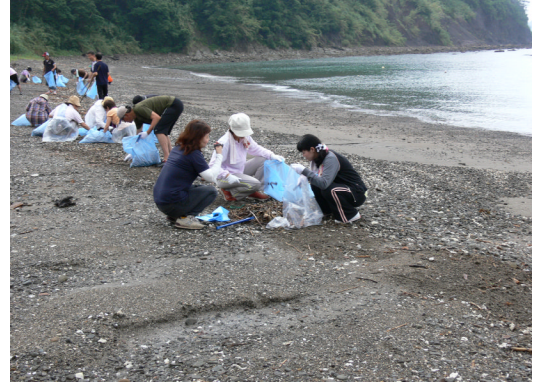
南郷町商工会女性部・青年部清掃ボランティア