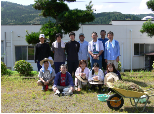
福祉施設清掃ボランティア