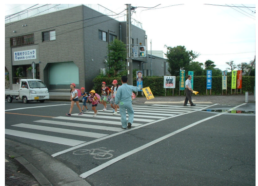
交通指導 串間支店