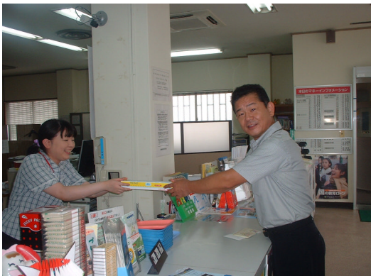
来店プレゼント 串間支店