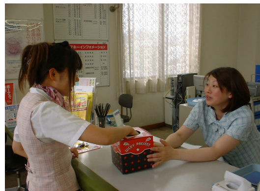
来店プレゼント 日南支店