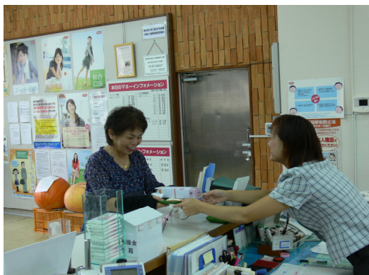
来店プレゼント 本店