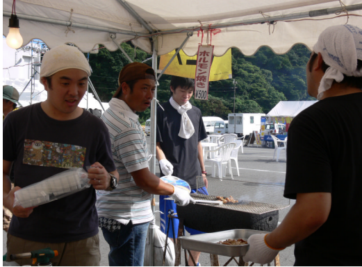
なんごう黒潮まつりへの参加