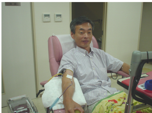
献血運動 日南支店