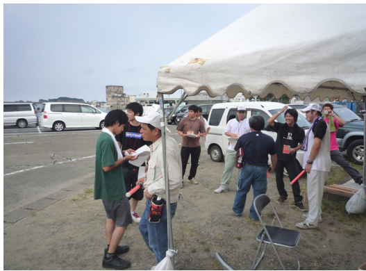
なんごう黒潮まつりへの参加