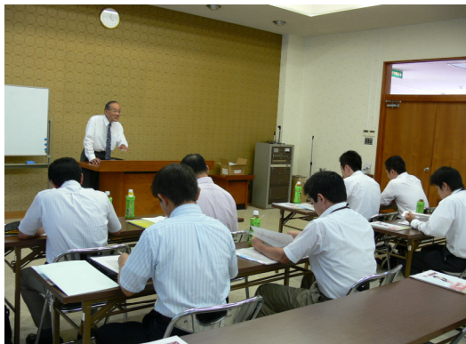
住宅ローン研修会