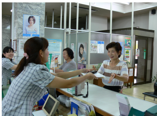
来店プレゼント 本店