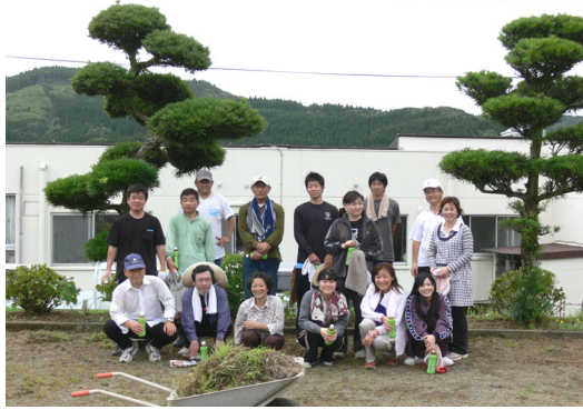
福祉施設清掃ボランティア