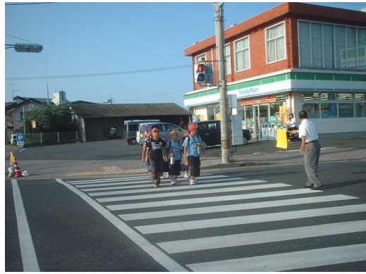
交通指導 串間支店