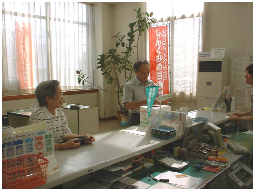
来店プレゼント 日南支店