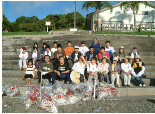
南郷町商工会女性部・青年部清掃ボランティア