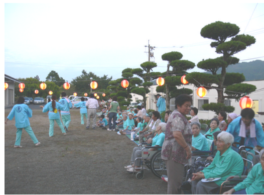
福祉施設盆踊り大会