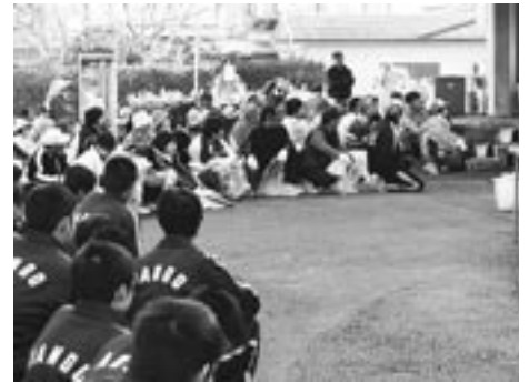
県民総ぐるみ運動 「クリーンアップ宮崎」への参加 19.11.11