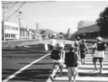
交通安全指導 串間支店