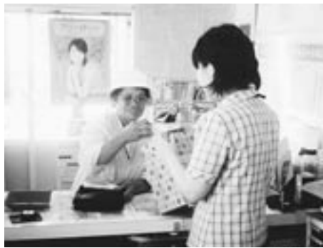
来店プレゼント 市木支店