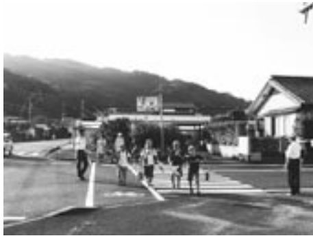
交通安全指導 本店