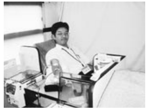
献血運動 日南支店