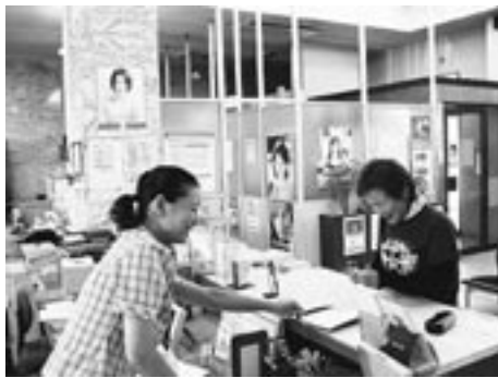
来店プレゼント 本店